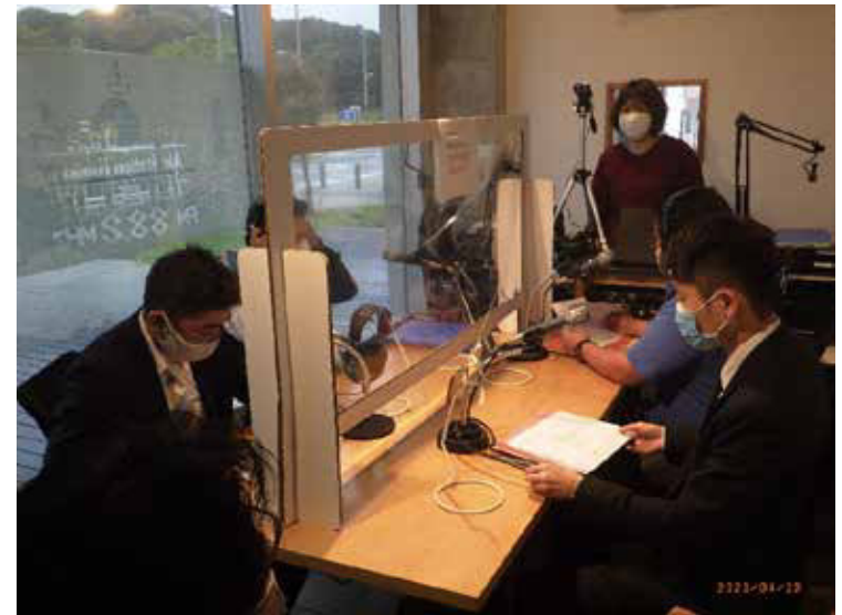
<FMラジオ番組「明日への扉」>