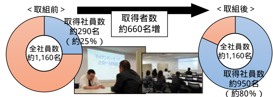
c社のマイナンバーカード取得状況