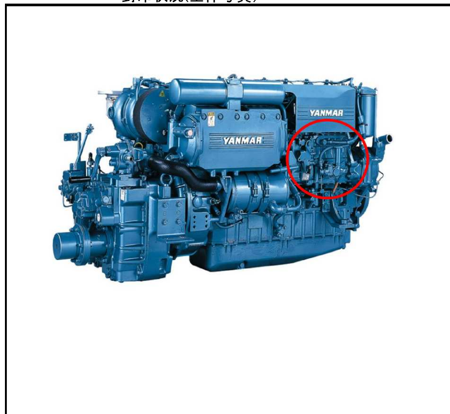
封印状況(全体写真)