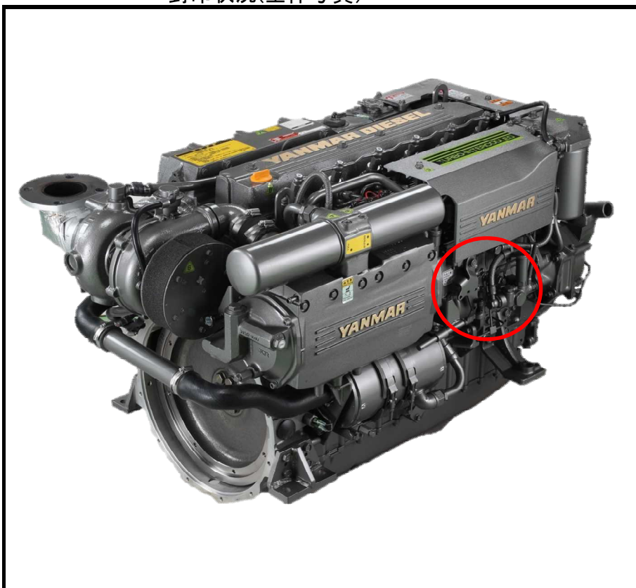
封印状況(全体写真)