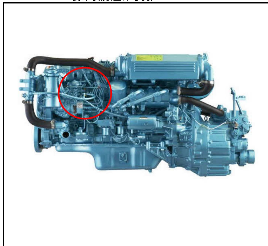
封印状況(全体写真)