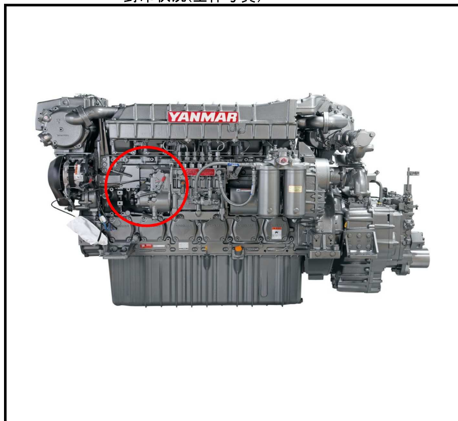
封印状況(全体写真)