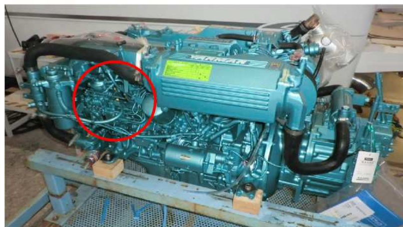
封印状況(全体写真)