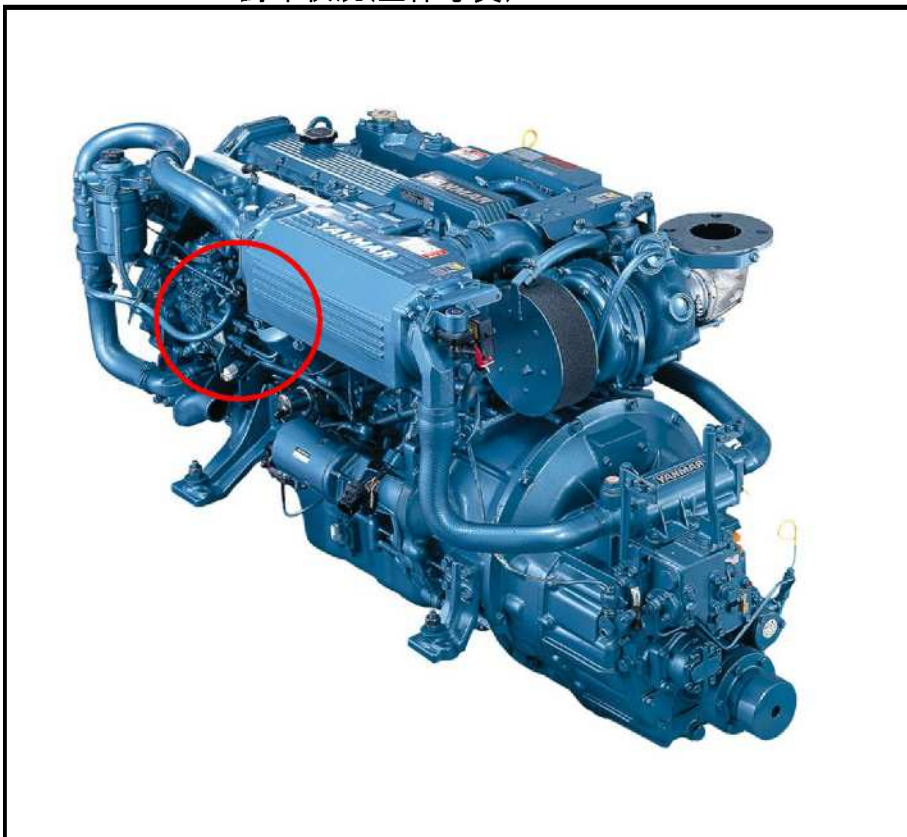
封印状況(全体写真)