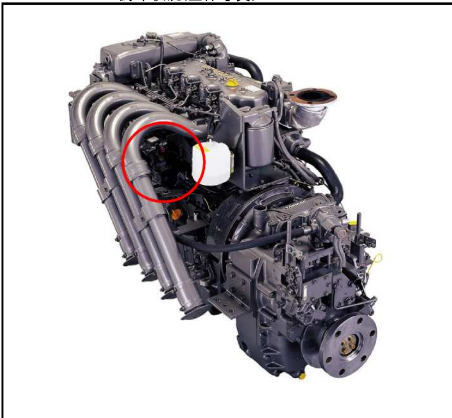
封印状況(全体写真)