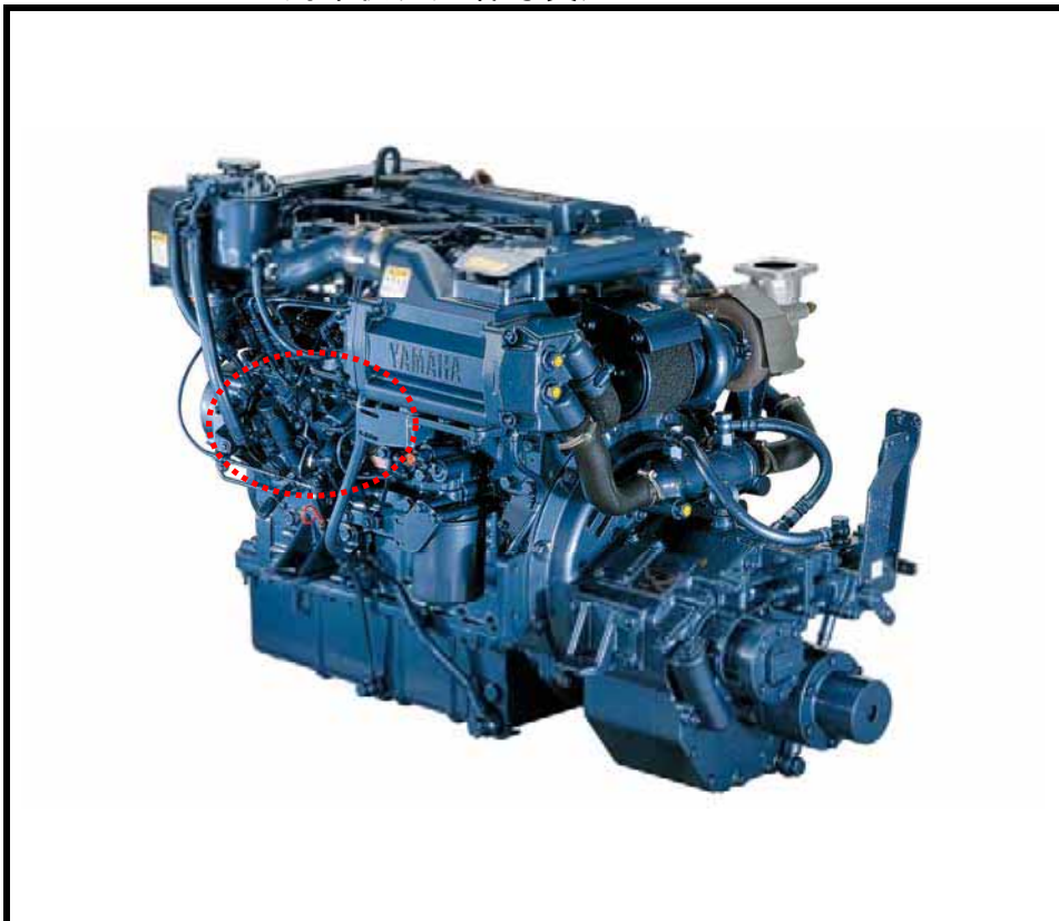
封印状況(全体写真)