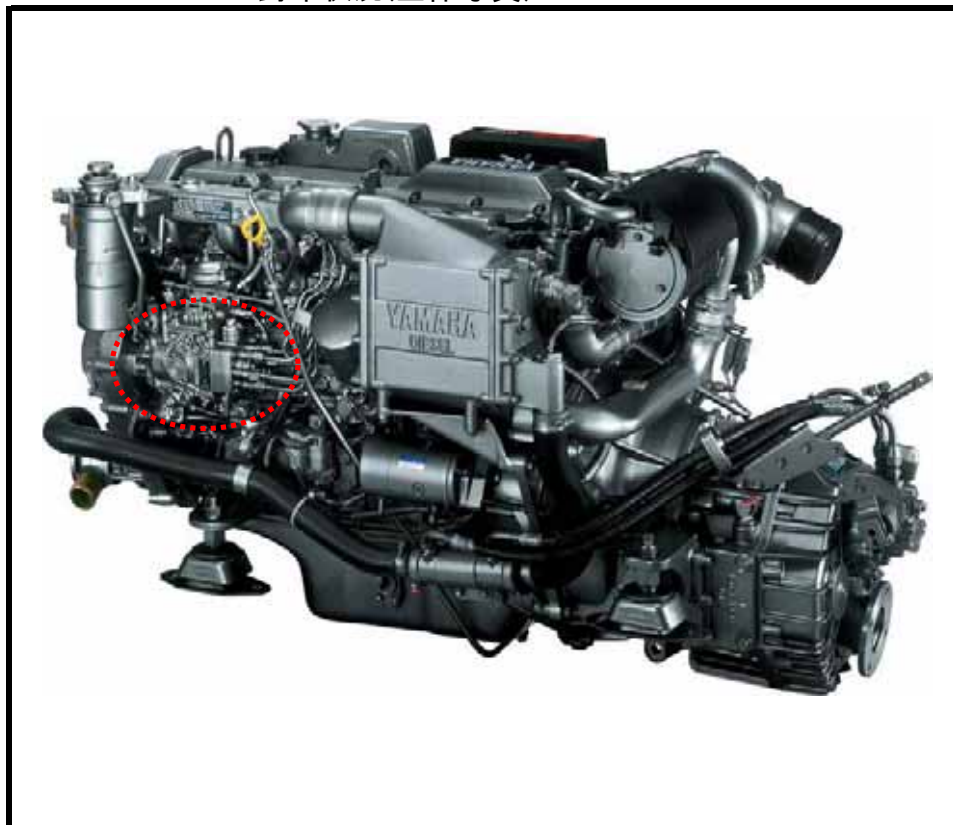
封印状況(制限装置カラー写真)