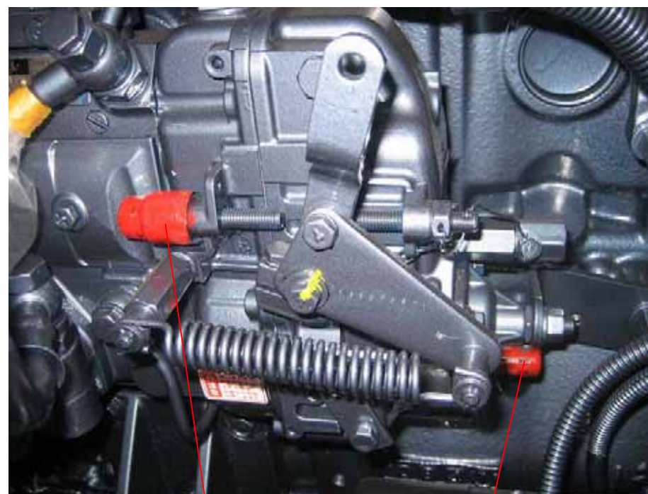
最大回転数制限装置