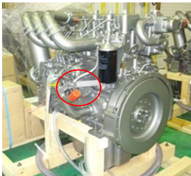
封印状況(全体写真)