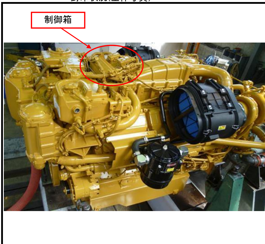
封印状況(全体写真)