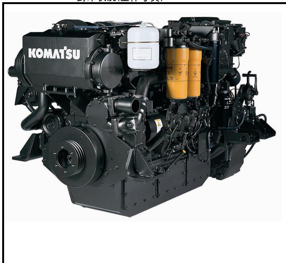
封印状況(全体写真)