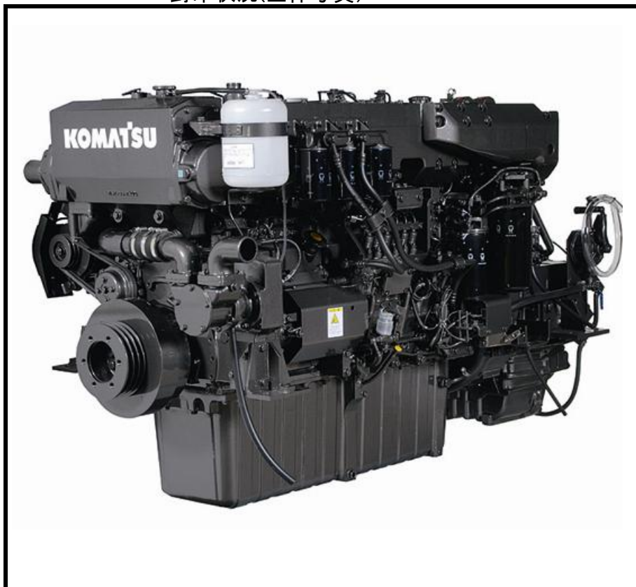
封印状況(全体写真)