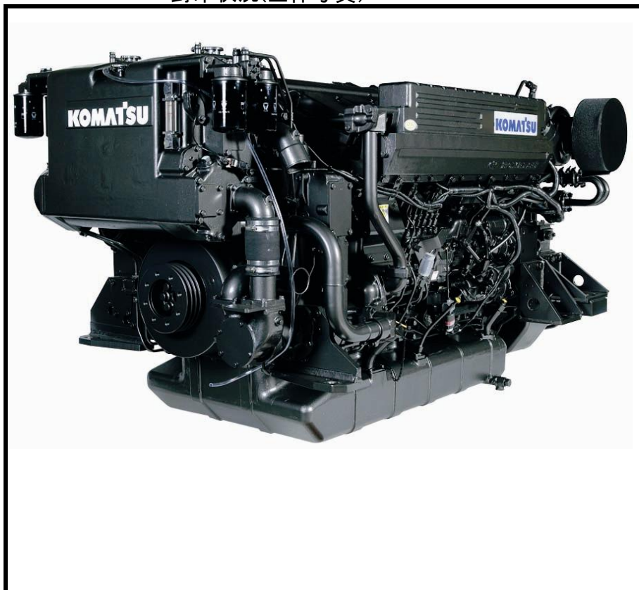
封印状況(全体写真)