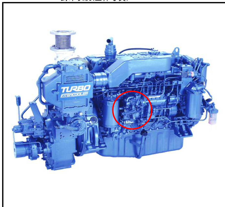
封印状況(全体写真)