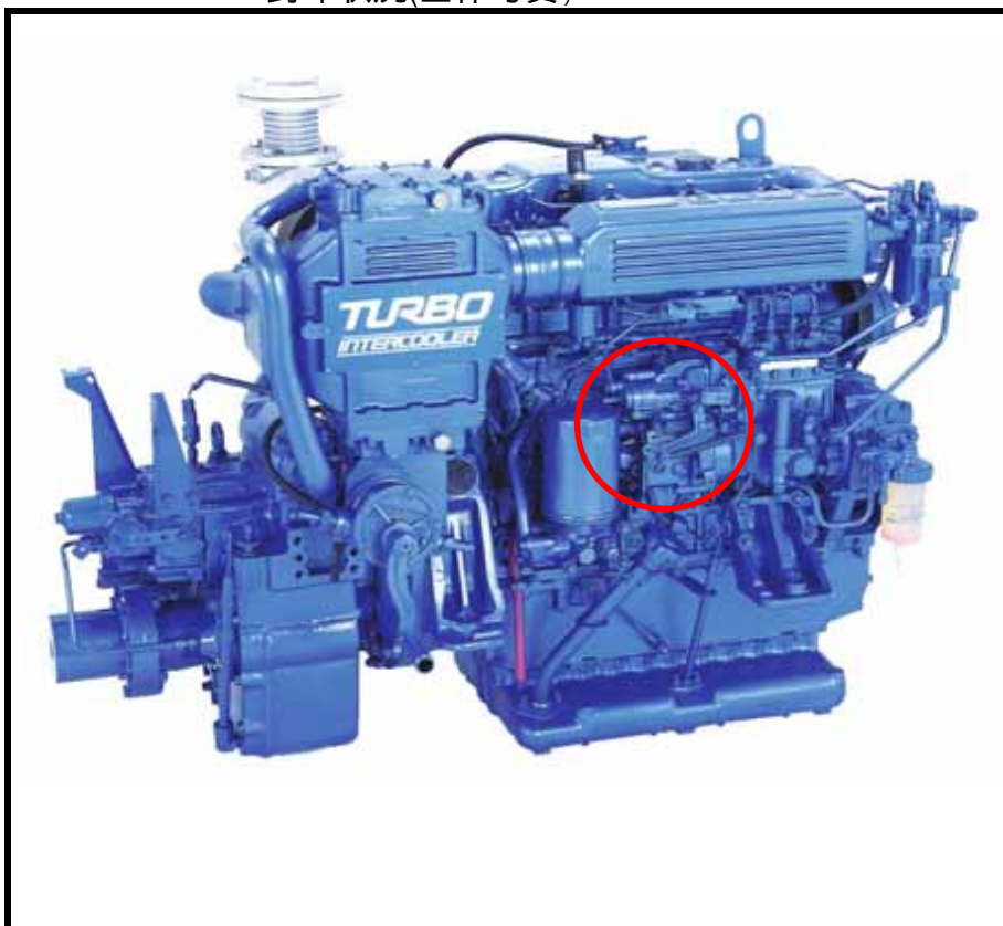
封印状況(全体写真)