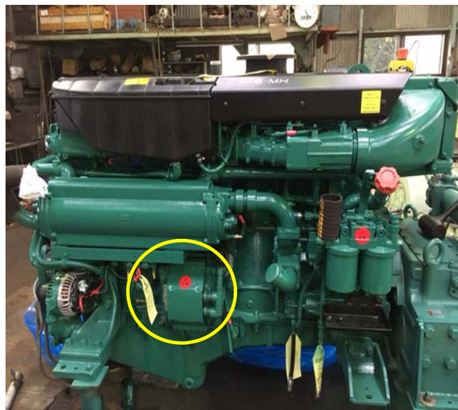
封印状況(全体写真)