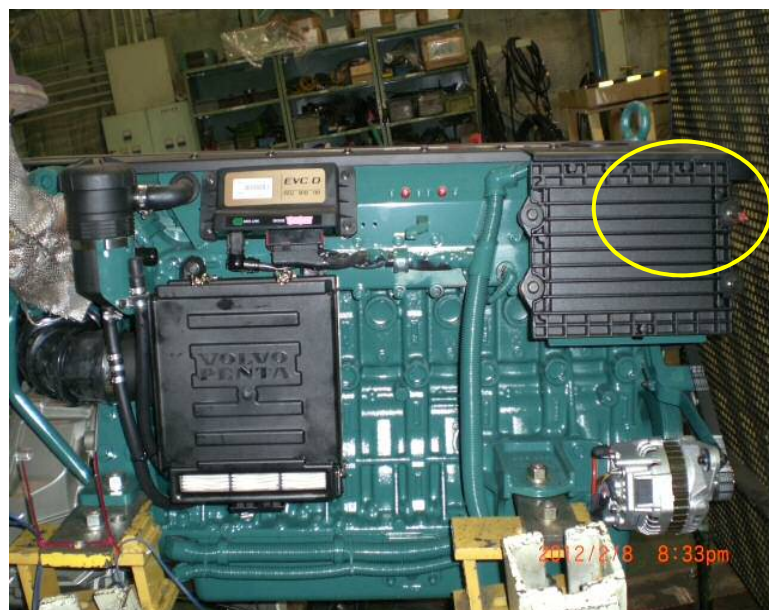
封印状況(全体写真)